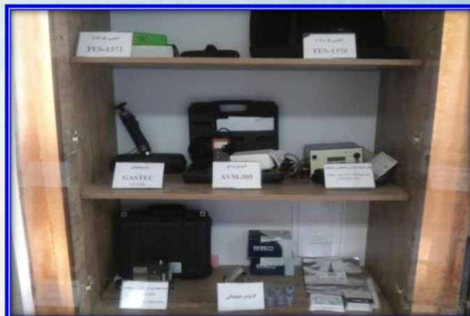
گاز متر خشک