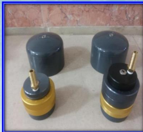
نمونه بردار PM